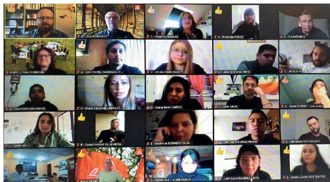
Teilnehmende der Abschlusskonferenz der Bildungsreihe 2018 – 2020 (als Ersatz für das Seminar in Deutschland)

Im Rahmen der Bildungsreihe konnten wir direkt erfahren, wie sich der globale Kapitalismus auf verschiedene Regionen der Welt auswirkt, wie es die Spaltung der Gesellschaft zwischen vielen Armen und wenigen Reichen vertieft.