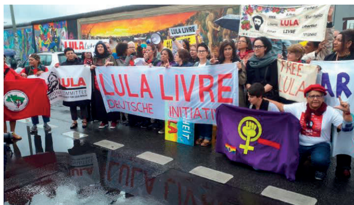
Das zweite Treffen der Fibra in Berlin im Sommer 2019. Die Lesung des Briefes von Lula vor der East Side Gallery

Das brasilianische Netzwerk ist auch in sozialen Netzwerken wie Twitter, Instagram und Facebook sehr aktiv. Der FIBRA-Kanal auf YouTube namens „Vozes de Fibra“ (Stimmen von Fibra) ist ein offener Kanal für Debatten, Diskussionen und Berichte über die Aktionen und Aktivitäten des brasilianischen Widerstands.