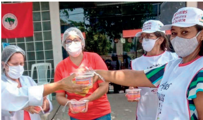
Verteilung von Fruchtsalat in Joao Pessoa

Die Landlosenbewegung hilft, Leben zu retten. Im Laufe ihrer fast 40-jährigen Geschichte gelang es, 480.000 Familien und damit über 2 Mio. Menschen im Rahmen der Agrarreform anzusiedeln. Ihre Aktionsform ist die Landbesetzung spekulativer - nicht produktiver – Agrarflächen, denn diese dürfen im Rahmen der Agrarreform enteignet und an Landlose übergeben werden. Ein langwieriger und gefährlicher Prozeß, denn die Großgrundbesitzer wehren sich mit Gewalt, ihren guten Kontakten zur Polizei und gedungenen Revolvermännern sowie vor Gericht. Derzeit leben ca. 75.000 Familien in Landbesetzungen, die noch nicht reguliert sind – werden von Polizei und Justiz wieder vertrieben, besetzen erneut...und die Großgrundbesitzer werden unter der Regierung Bolsonaro immer dreister und brutaler, denn sie haben wenig zu befürchten.